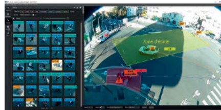
Utilisation non-autorisée des pistes cyclables par les deux-roues motorisés.

La plateforme intelligente minUi est aussi applicable à de l'analyse en temps réel. Les finalités sont multiples : régulation trafic, détection d'usages non autorisés de voies dédiées, dépassement de la durée de stationnement en zones bleues, stationnement gênant en plein carrefour :