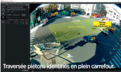
Traversée piétons identifiés en plein carrefour.