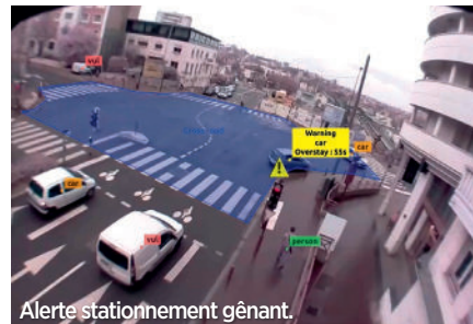
Alerte stationnement gênant.