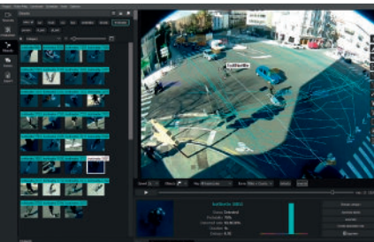
Observation de l'utilisation de la voirie par les trottinettes électriques. Les trajectoires colorées montrent l'usage de ce mode sur l'axe routier principal.